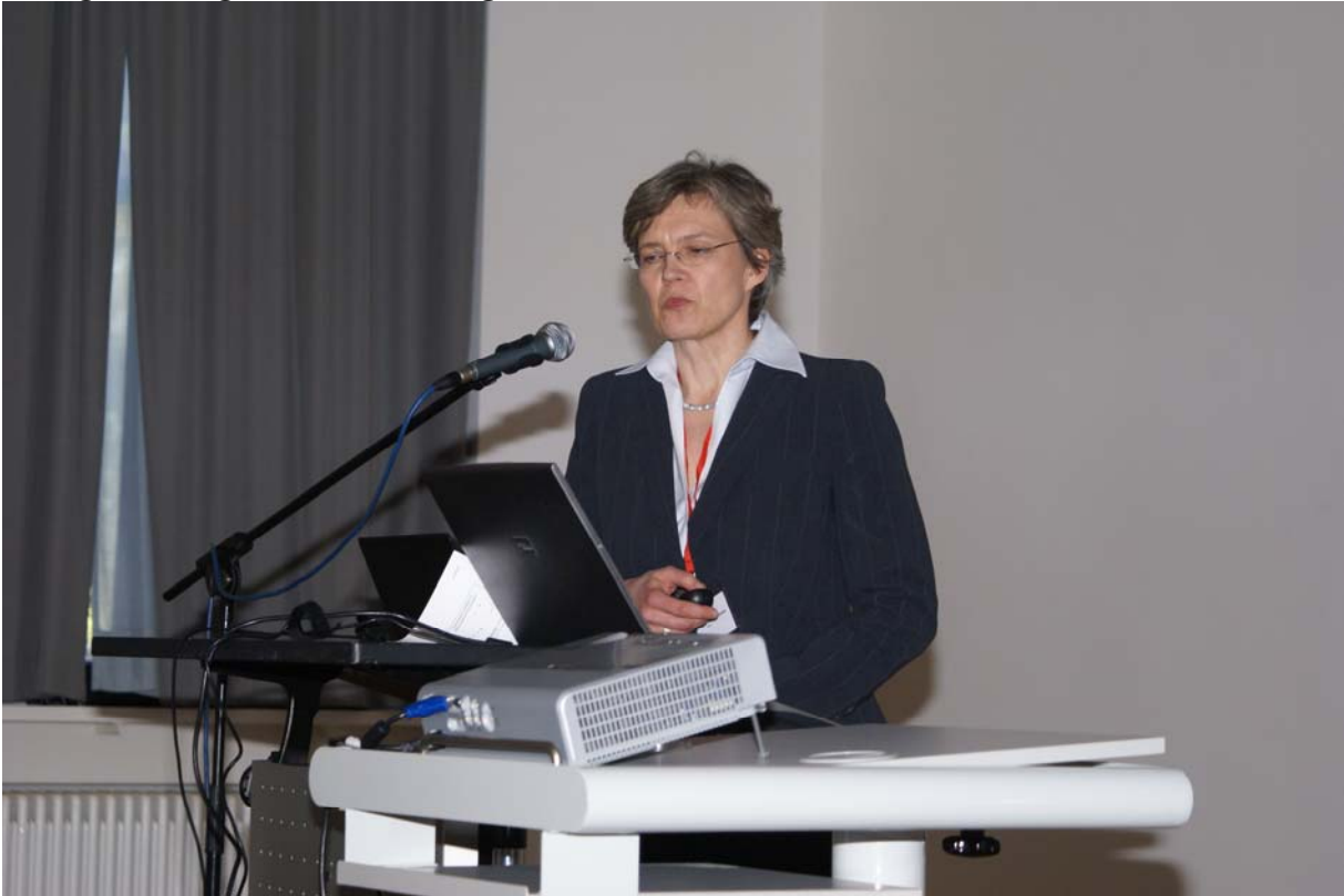
Freitag Vormittag, 16.04., Vorstellung der GSK-StiL Studie OMBI10918/NHL 9-2010