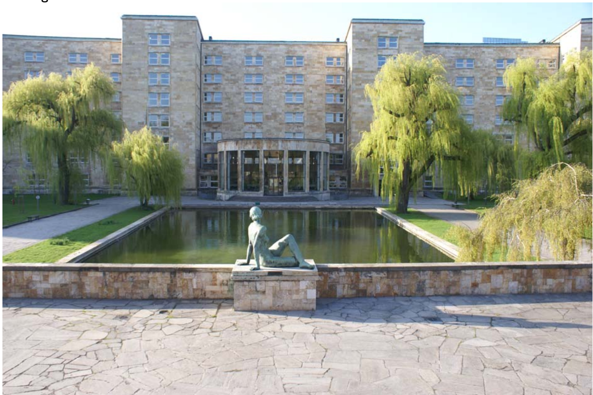
Fritz Bauer Institut – IG Farben Gebäude