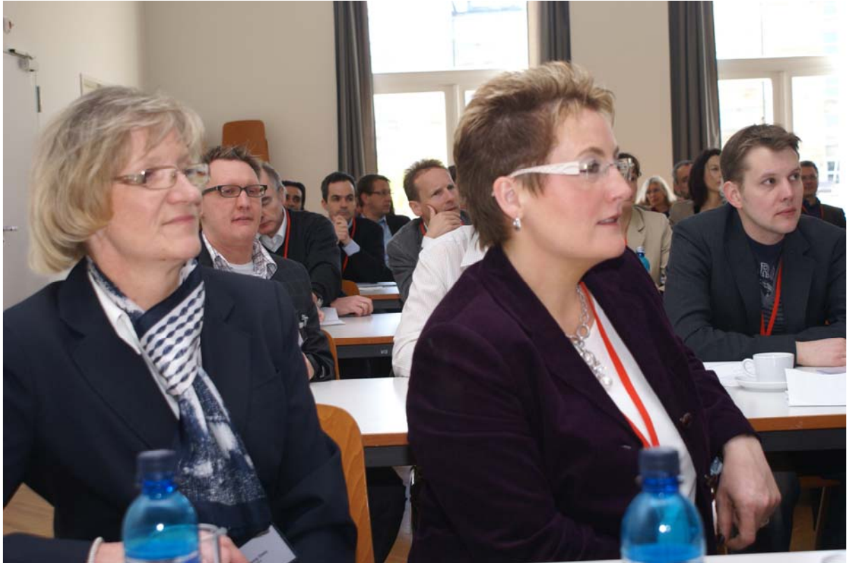
Vorstellung der Studienzentrale