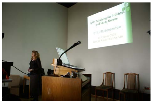
Von der Landesärztekammer Hessen mit 12 Punkten anerkannt.