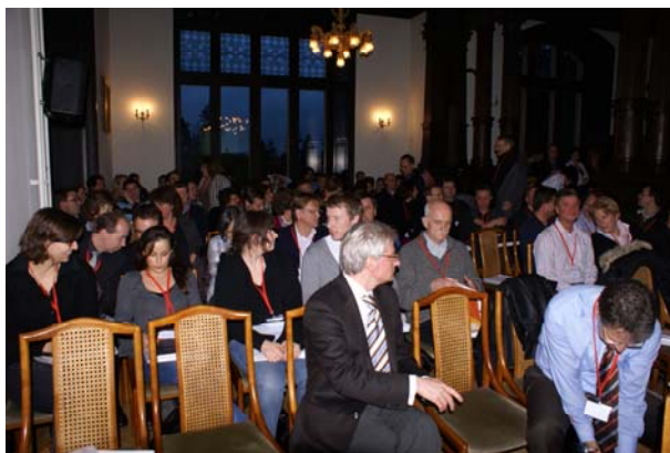
Ein gut gefüllter Saal für eine umfassende GCP-Schulung.