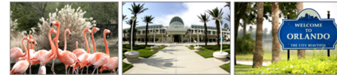
52 nd ASH Annual Meeting in Orlando